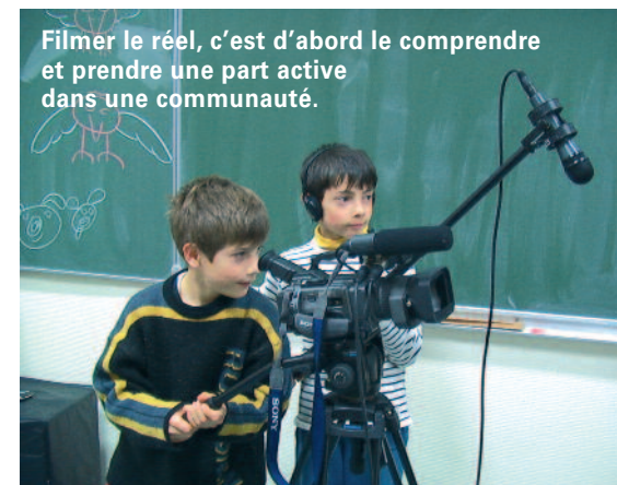
Filmer le réel, c'est d'abord le comprendre et prendre une part active dans une communauté.

Le documentaire est un outil pédagogique pour une découverte du langage cinématographique et une ouverture au monde à partir d'une démarche culturelle et artistique.